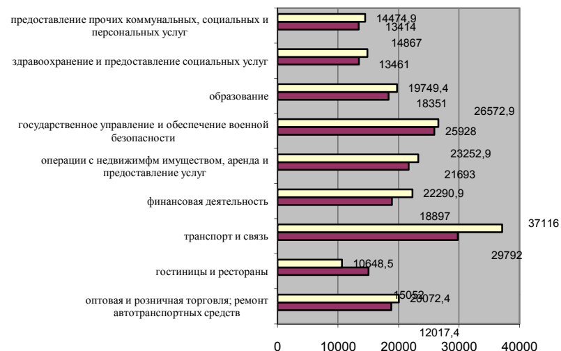
Среднемесячная начисленная заработная плата, руб.